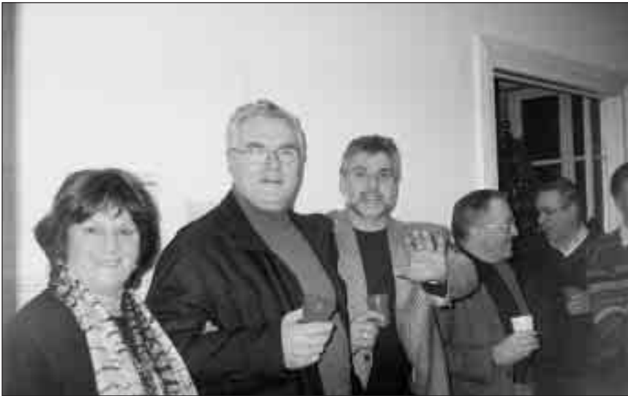
Il Sindaco di Cherso nella sede della Comunità Italiana per festeggiare il Nuovo Anno

Sabato, 4 gennaio del c. a., mi trovavo fortunatamente a Cherso e potevo così partecipare, assieme a mia moglie, alla riunione indetta dalla Comunità Chersina della minoranza italiana per festeggiare il nuovo anno.