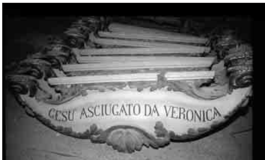
Archivio di Corrado Ballarin: le "tabelle" delle stazioni della Via Crucis