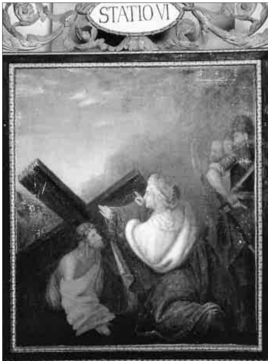
una stazione della Via Crucis del Duomo di Lussingrande