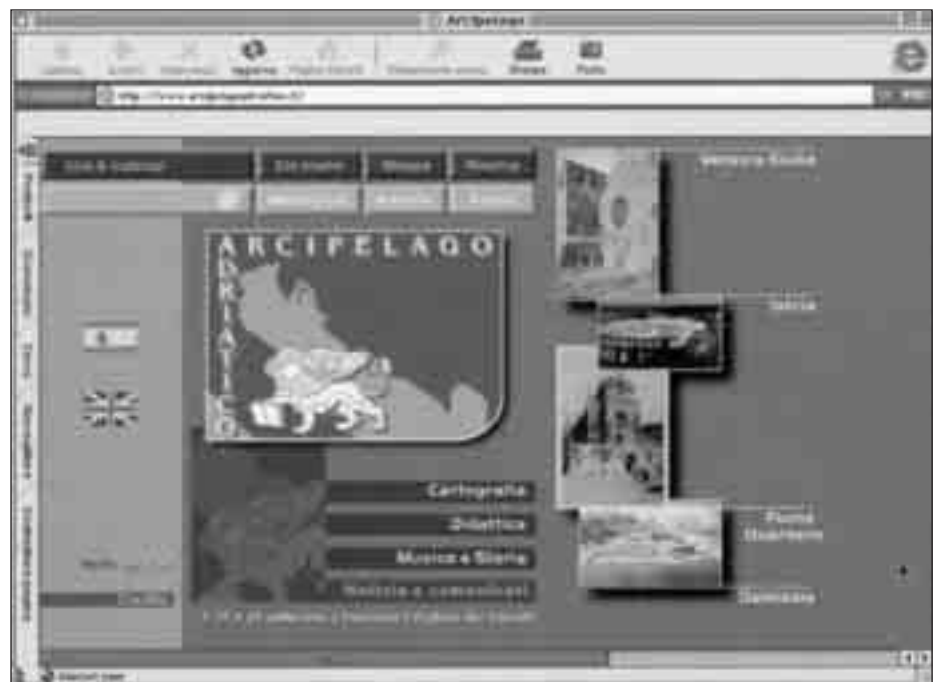
Home page del Centro di Documentazione Multimediale (CDM) al servizio della cultura Giuliana, Istriana, Fiumana, Dalmata - indirizzo internet: www.arcipelagoadriatico.it