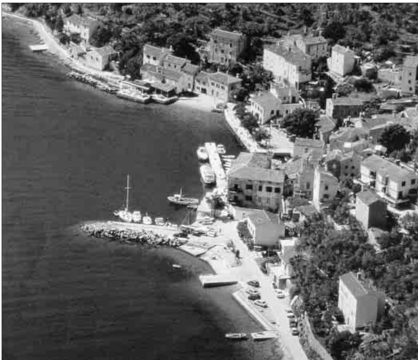
Vallone di Cherso, dall'archivio di Corrado Ballarin.

Spediz. in abb. post. art. 20/c, L. 662/96, Fil. di Trieste - Quadrimestr. n. 47 - Iscritto al n. 718 del Reg. giornali e periodici del Trib. di Trieste - 26.1.1988