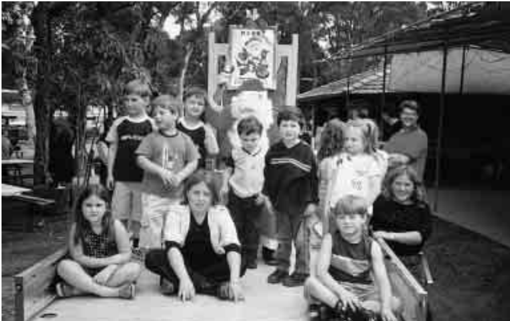
Il gruppo di bambini con Babbo Natale