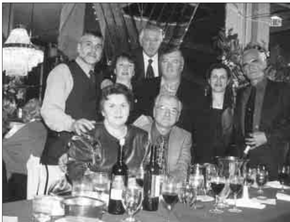
Il Sindaco di Cherso con alcuni chersini residenti in America.

Noi, qui presenti, rappresentiamo il collegamento tra il mondo nuovo e il vecchio.