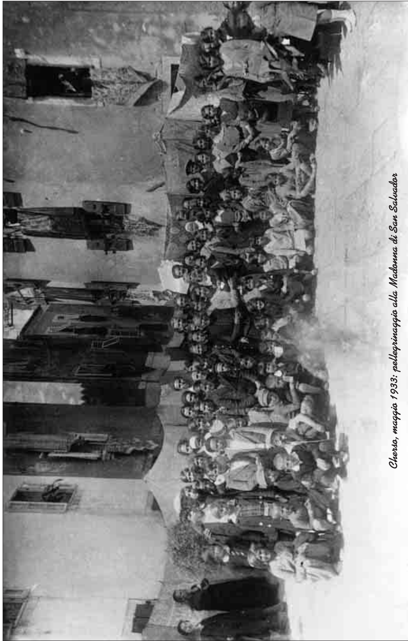
Cherso, maggio 1933: pellegrinaggio alla Madonna di San Salvador